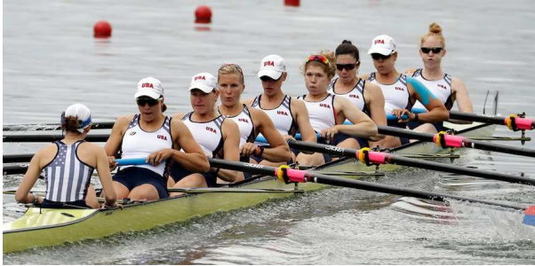
8人の漕手が漕ぎ、1人のコックスが舵をとる「エイト」