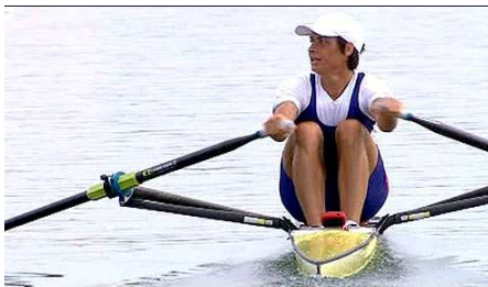
1人漕ぎの「シングルスカル」