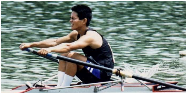
キャッチから強くドライブしていこう。

キャッチでは、特に艇の減速を小さく・短くすることが一番重要で、しっかり前に出て、丁寧・確実にキャッチすることがとても重要です。また、フライアップやエントリーでのスリップをなくすことに注意を払うべきです。