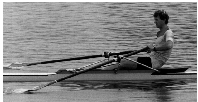
適度なバック姿勢へ、ハンドルを強く滑らかにひきつける。

スカルでは、フィニッシュでハンドルが脇腹付近にきます。リギングが適切でない場合は、腹部にあたるか、あるいは脇から離れる状態になります。