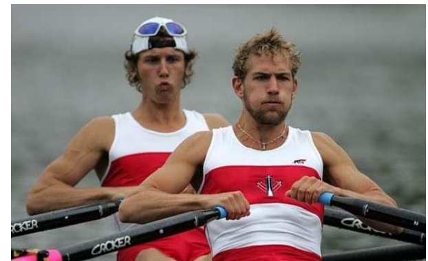
肘を水平後方に回す感じ(2005年世界U23)

ファイナルへ向かっては腋が適度に開き、肘を水平後方に回転させるように動かします。