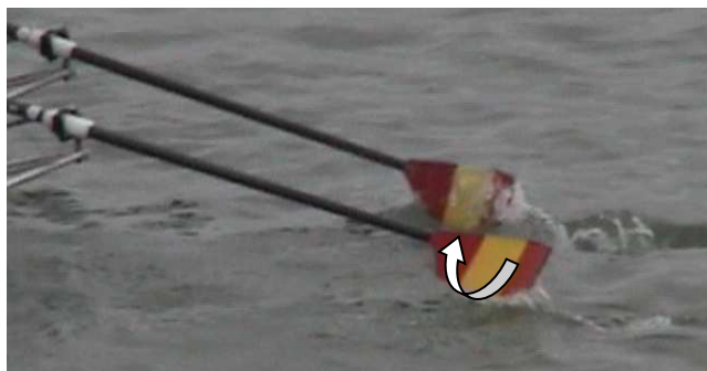
フィニッシュでのフェザーターン。

フェザー Feather (-ing) : フィニッシュ(直後)に、ブレードを回転させて水平にすることです。フォワードの時の空気抵抗を減らすためです。