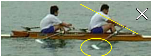
明らかにワーク高が低過ぎる例(特に整調): フォワードでハンドルが低いにも拘らず、なお(両舷の)ブレードが水面に接触している。

「最適のハンドル高さ」と最適のブレード深さの直線上に、オールロックの高さが決まると考えるとわかりやすいでしょう。ここで、ハンドルやオールロックの高さは、シートからの高さだけでなく、水面からの高さが重要となります。