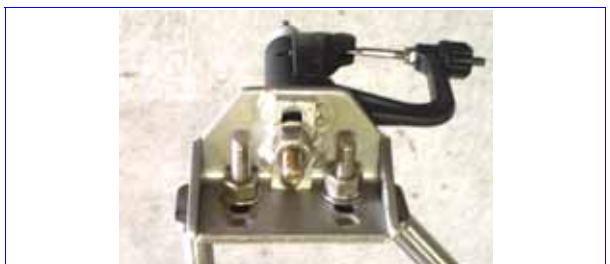
L板は孔の位置でハイトを調整できる

ワーク高の調節方法は、リガーの構造によって異なります。リガーの取り付け位置の変更、(リガーの取り付け部にスペーサの挟み込み)、多孔式か長穴式のL板の差し替え、ピンのワッシャーの差し替えなどで行います。