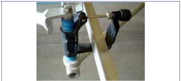
ハイトを計測するときは、「ミドルの位置で」シルの中心で