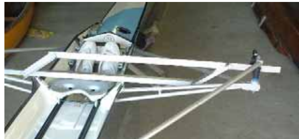
ガンネルからオールロックまでの高さの計測