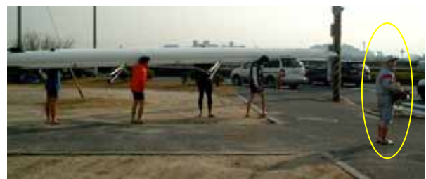
このように舵手は少し離れて全体が見渡せる位置をとる。

舵手は艇から少し離れ、常に艇全体を見ることのできる位置に立ちます。舵手や補助者がバウポールまたは艇尾を持って移動するのは、一見安全そうですが、艇の另一端のリスクが高まり、また舵手のレベルアップの障害にもなります。舵手は、手を触れることなく、声だけで漕手を介して艇を制御します。もちろん、初心者のクルーでは、また大会会場などの混雑した状況では、サポートがあっても良いでしょう。しかし舵手自身は、最終的に、艇から離れた位置で全体を見渡しながら、クルーをしっかりとコントロールできるようにするのが、とても重要です。