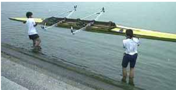
ダブルスカルは、前後デッキの中央～中寄りで持ちましょう

ダブルスカルは、艇端から約2mのあたりを持ちます。端で持ったまま長く運んではいけません。