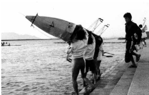
肩に担いだ艇を差し上げ、回転しながら水面に降ろす

艇を回転させるときは、タイミングを合わせ、艇軸を常に地面に平行に。合わせないと、艇が傾き地面に接触します。