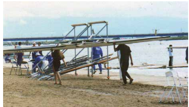
シングルスカルを二人で運ぶ場合。(ハードデッキの場合は裏返して)

シングルスカルの場合は、基本は一人で、デッキを下にシートを頭に載せるか、横にしてガンを肩に載せ運びます。ハルを下にする場合、細心の注意が必要で、注意しないとすぐにハルを傷めます。慣れないうちは、2人で両端から1m～2m内側を持つか、補助をつけて運びましょう。