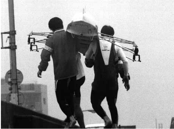
艇の運搬は上下動を少なく丁寧に

艇は、上下動をできるだけ少なくし、また、まわりの人や物に当たらないよう、注意しながら声をかけながら運搬します。