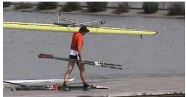
裏返して運ぶのが基本。ハルを下にして運ぶ時は極力慎重に！ また基本的には、(上のようにでなく)艇とオールは別に運ぼう。