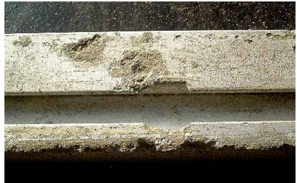
特に海域では、十分な水洗いをしないと軽合金の電食が進む。

海域では、少なくとも毎月1回、分解してきれいにクリーニング&防錆処理すべきです。淡水域でも、約3カ月ごとにクリーニングしたいものです。