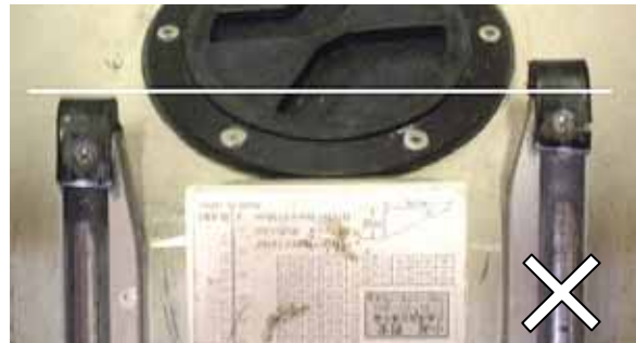
左右のレールは正確にそろえる。ずれると脱線のリスクが高まる。

左右のレールの前後位置を正確に揃えておきましょう。左右のレール位置が違っていると、前に出しすぎたレールが無駄であるばかりでなく、フロントストップにローラーが当たったときシートを回転させ、脱線の原因になります。