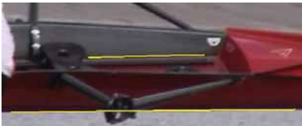
レールを載せるデッキ自体が傾斜しているタイプ