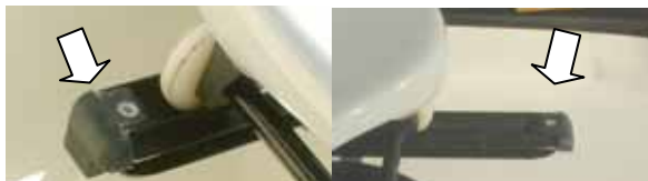
フロントストップ、バックストップは、小さいけれど大切な部品

レールの先端にはフロントストップが、後端にはバックストップがあり、シートが外れないようになっています。