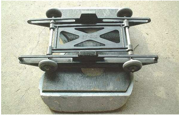
ダブルアクション・タイプ