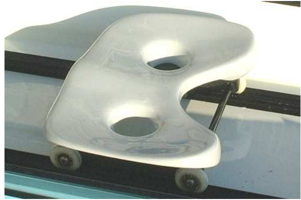
シングルアクション・タイプ